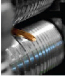
VALSNING. Guldstaven rullas först i fläckvalsen och därefter i profilvalsen.