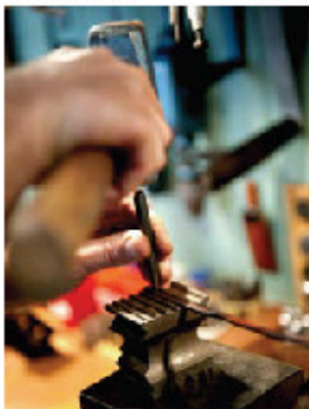
FEM stämplor slås in. CSF, C, GR, 18 K och NIL, i faktarutan finns deras betydelse förklarade.