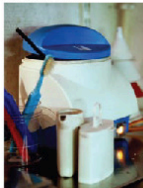
RENGÖRNING. Guldbiten syras för att få bort oxiderna som uppstår vid bearbetningen.