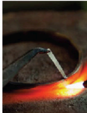
ARMBANDET löds ihop med slaglod. Därefter träs det på en ovalformad kon och bankas ut till denna form. Grovarbetet är nu klart.