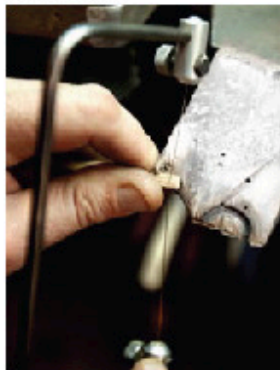
EN EXTRA BIT GULD behövs när det ska lödas samman och bli cirkelformat.